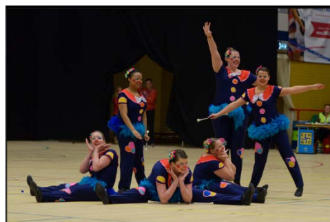
Senior Dance Team