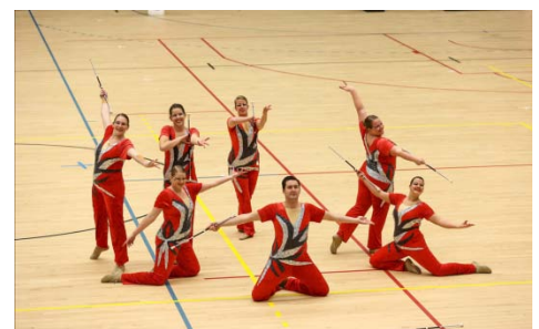
Senior Twirl Team