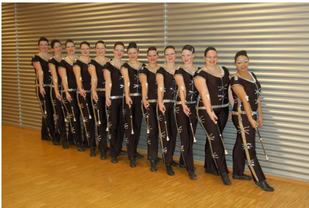
Large Team Senior