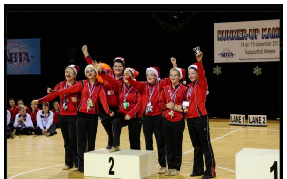
Junior Twirl Team

Als bestuur zijn wij bijzonder trots op de prestaties van de leden maar ook zeker van de instructeurs die onze leden zover krijgen. Wij hopen dat dit jaar weer een succesvol jaar mag worden met misschien wel meer solisten op de N.K.'s en wie weet hoeveel teams daar weer aan mogen deelnemen. Wij wachten het weer af.